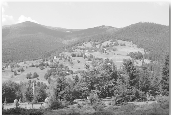
Bihar-hegység az Aranyos völgyéből